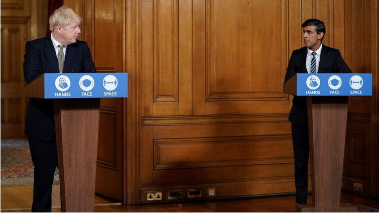
பிரதமர் போரிஸ் ஜோன்சன் அக்டோபர் 10, 2020 அன்று கருவலத் தலைவர் ரிஷி சுனக் உடன் கோவிட் -19 செய்தியாளர் சந்திப்பை நடத்துகிறார்

13. அமெரிக்காவில், நியூயோர்க் டைம்ஸ் கட்டுரையாளர் தோமஸ் ஃப்ரீட்மேன் ஸ்வீடனின் பொறுப்பற்ற கொள்கையை ஏற்றுக்கொண்டு, 'சிகிச்சையானது நோயை விட மோசமாக இருக்க முடியாது' என்ற சொற்றொடரை உருவாக்கினார், இது விரைவில் டொனால்ட் டிரம்பின் வேலைக்கு திரும்பிச் செல், பொதுமுடக்க எதிர்ப்பு (anti-lockdown) பிரச்சாரத்திற்கான தாரக மந்திரமாக மாறியது. கோவிட் , முதலாளித்துவம் மற்றும் வர்க்கப் போர்: பெருந்தொற்று நோயின் ஒரு சமூக மற்றும் அரசியல் காலவரிசை வெளியீட்டின் அறிமுகத்தில், உலக சோசலிச வலைத் தளம் பின்வருமாறு குறிப்பிட்டது: