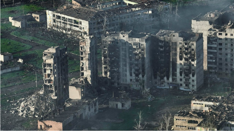
புதன்கிழமை, ஏப்ரல் 26, 2023 அன்று உக்ரேனின் டோனெட்ஸ்க் பிராந்தியத்திலுள்ள பக்முத்தின் இந்த வான்வழிக் காட்சியில் கட்டிடங்களிலிருந்து புகை எழுகிறது.

சாத்தியத்தையும், வாய்ப்பையும் கூட நடைமுறையில் ஏற்றுக்கொள்வதுடன் சேர்ந்துள்ளது. பைடென் நிர்வாகம் அடிக்கடி பொருளாதாரத் தடைகளை விதிக்கிறது மற்றும் ரஷ்ய சொத்துக்கள் மற்றும் பிரதேசங்கள் மீது இராணுவத் தாக்குதல்களுக்கு உத்தரவிடுகிறது. அணுஆயுத பதிலடியைத் தூண்டும் அபாயத்தால் பனிப்போரின் போது ஏற்றுக்கொள்ள முடியாததாக இத்தகைய நடவடிக்கைகள் கருதப்பட்டது. “சிவப்புக் கோடுகளை” மீண்டும் மீண்டும் கடக்கும் பைடென் நிர்வாகமும் அதன் கூட்டணி நேட்டோ அரசாங்கங்களும், தாங்கள் மேற்கொள்ளும் இராணுவ நடவடிக்கைகள் அணுஆயுதப் போர் அச்சுறுத்தலால் கட்டுப்படுத்தப்படாது என்று வலியுறுத்தியுள்ளன.