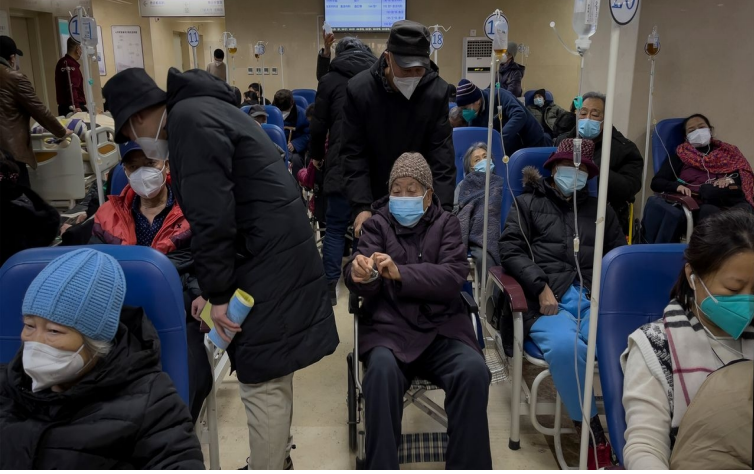
சீனாவிலுள்ள ஒரு மருத்துவமனையின் அவசர சிகிச்சைப் பிரிவு, ஜனவரி 3, 2023.

கோவிட்' கொள்கையில் ஒருங்கிணைக்கப்பட்டுள்ளது. கடந்த ஆண்டில் நோய்த்தொற்று மற்றும் இறப்புகளின் பல அலைகளுக்குப் பிறகு, நாட்டின் 1.4 பில்லியன் மக்கள்தொகையில் 100 மில்லியனுக்கும் அதிகமான சீன மக்கள் இப்போது நெடும் கோவிட் (Long COVID) நோயால் பாதிக்கப்பட்டுள்ளனர்.