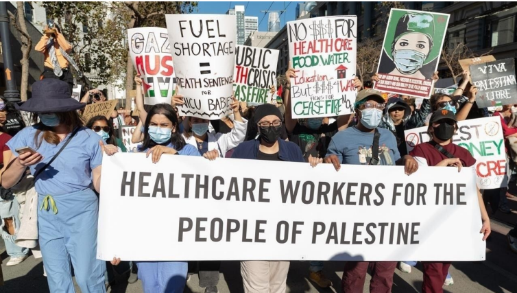
கலிபோர்னியாவின் சான்பிரான்சிஸ்கோவில் சுகாதார ஊழியர்களின் அணிவகுப்பு, அக்டோபர் 28, 2023.

15. ஏகாதிபத்திய நாடுகளில் மிகப் பெரிய ஆர்ப்பாட்டங்கள் லண்டனில் நடந்துள்ளன (நவம்பர் 11 அன்று கிட்டத்தட்ட 1 மில்லியன் மற்றும் பல போராட்டங்களில் 100,000 பேர்கள்); வாஷிங்டன் டி.சி (நவம்பர் 4 அன்று 300,000 க்கும் மேற்பட்டவர்கள்); நியூயோர்க் நகரம், சிக்காகோ மற்றும் லொஸ் ஏஞ்சல்ஸ் (பல ஆர்ப்பாட்டங்களில் 10,000 பேர்கள்); சிட்னி மற்றும் மெல்போர்ன் (நவம்பர் 12 அன்று தலா 50,000 க்கும் மேல்); பேர்லின் (போலீஸ் தடையை மீறி அக்டோபர் 28 அன்று 10,000 க்கும் மேற்பட்டவர்கள்); பாரிஸ் (அக்டோபர் 22 அன்று 15,000 க்கும் மேற்பட்டவர்கள்); ஆம்ஸ்டர்டாம் (அக்டோபர் 15 அன்று 15,000 க்கும் மேல்); ரொறன்ரோ (அக்டோபர் 10 அன்று 15,000 க்கும் மேற்பட்டவர்கள்); மற்றும் டோக்கியோ (நவம்பர் 20 அன்று 1,500). இனப்படுகொலைக்கு எதிராக, குறிப்பாக அரபு உலகம் முழுவதும் மில்லியன் கணக்கானோர் ஆர்ப்பாட்ட எதிர்ப்பில் ஈடுபட்டிருந்தனர்.