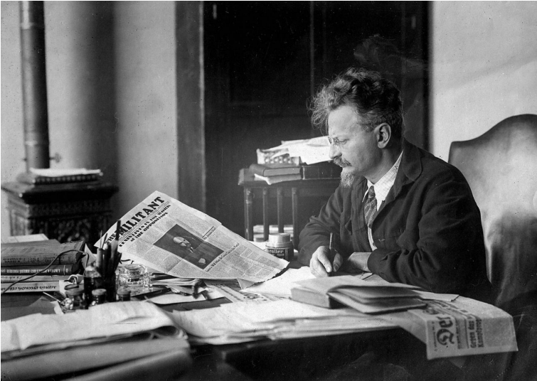
மெக்சிகோவில் லியோன் ட்ரொட்ஸ்கி

பொருளாதார வாழ்க்கையை அரசு அதிகாரத்துவத்தைப் போலவே அதே உயரத்திலிருந்து பார்க்கின்றன. ஒவ்வொரு கட்டத்திலும் பிந்தையவர்களின் (அரசு அதிகாரத்துவம்) ஒத்துழைப்பு அவர்களுக்குத் தேவைப்படுகிறது. தொழில்துறையின் மிக முக்கியமான கிளைகளிலுள்ள தொழிற்சங்கங்கள் வெவ்வேறு நிறுவனங்களுக்கு இடையிலான போட்டியிலிருந்து இலாபம் ஈட்டுவதற்கான சாத்தியக்கூறுகளை பெறமுடியாமல் இழக்கின்றன. அரசு அதிகாரத்துடன் நெருக்கமாக பிணைந்துள்ள ஒரு மையப்படுத்தப்பட்ட முதலாளித்துவ எதிரியை அவர்கள் எதிர்கொள்ள வேண்டும். எனவே, தொழிற்சங்கங்கள் (அவர்கள் சீர்திருத்தவாத நிலைப்பாட்டில் இருக்கும் வரை, அதாவது, தனியார் சொத்துக்களுக்கு தங்களை மாற்றிக் கொள்ளும் நிலைகளில்) முதலாளித்துவ அரசுக்கு தங்களைத் தகவமைத்துக் கொள்ளவும், அதன் ஒத்துழைப்பிற்காகப் போராடவும் வேண்டும்.