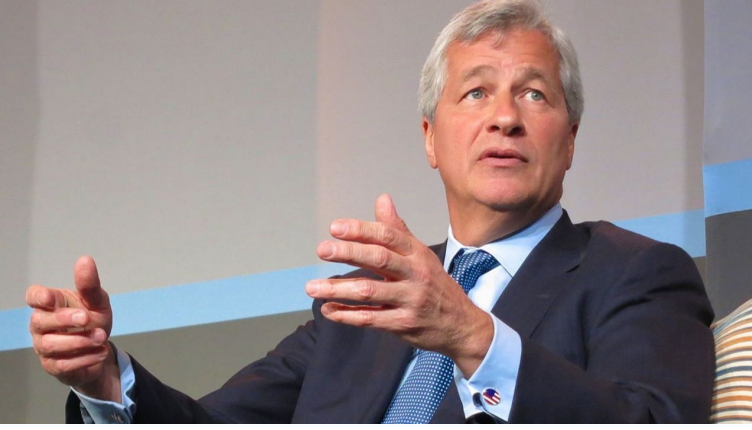
ஜேபி மோர்கன் ஹெல்த்கேர் முதலீட்டு மாநாட்டில் ஜேமி டிமோன்.