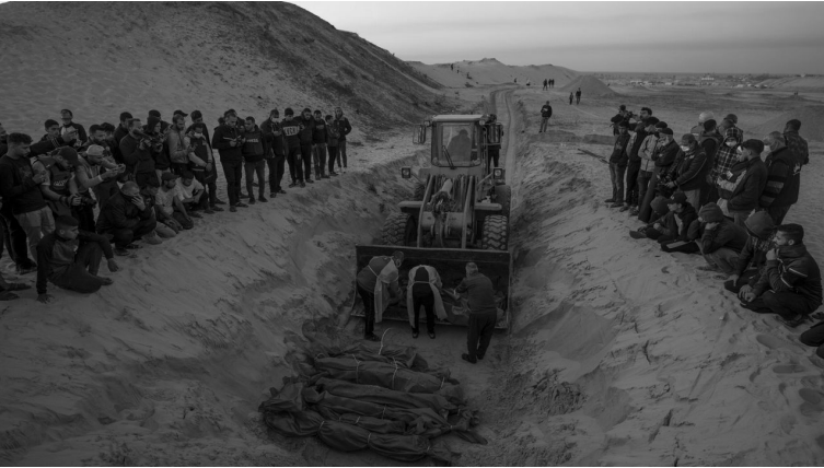
காஸா பகுதியில் ரஃபாவிலுள்ள மனித புதைகுழியில் இஸ்ரேலால் கொல்லப்பட்ட பாஸ்தீனியர்களின் உடல்களை புல்டோசர் செவ்வாய்க்கிழமை, டிசம்பர் 26, 2023 அன்று இறக்குகிறது.

3. இஸ்ரேலின் பாசிச பிரதம மந்திரி பெஞ்சமின் நெதன்யாகு தனது புத்தாண்டுச் செய்தியில், தாக்குதல் 2024 முழுவதும் தொடரும் என்று அறிவித்தார். அமெரிக்கா மற்றும் அதன் நேட்டோ சக குற்றவாளிகளின் வரம்பற்ற நிதி மற்றும் இராணுவ ஆதரவு இல்லாமல், இஸ்ரேல் இன்னும் ஒரு வாரம், ஒரு வருடம் இதை குறிப்பிட வேண்டிய அவசியமில்லை, போரைத் தொடர முடியாது. அமெரிக்க ஜனாதிபதி, வெளிவிவகாரச் செயலாளர், எண்ணற்ற ஏனைய உயர் அரசாங்க அதிகாரிகள் மற்றும் பென்டகனின் உயர்மட்ட அதிகாரிகள் ஆகியோர் வாஷிங்டனுக்கும் டெல் அவிவிற்கும் இடையில் முன்னும் பின்னுமாக பயணித்து, இஸ்ரேலிய நடவடிக்கைகளை மேற்பார்வையிட்டு, குண்டுவீச்சு இலக்குகளைத் தேர்ந்தெடுப்பதில் பங்கெடுத்தனர். அமெரிக்க மற்றும் நேட்டோ படைகள் காஸாவிற்குள் களத்தில் கொலைகார நடவடிக்கைகளில் நேரடியாக ஈடுபட்டுள்ளனர் என்பது பகிரங்கமான இரகசியமாகும்.